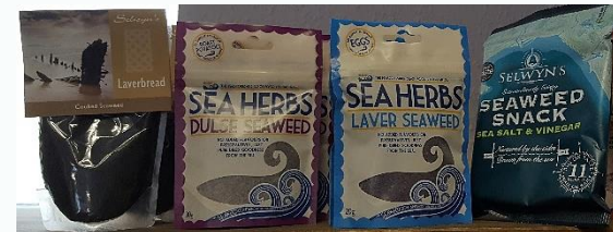
PECYNNAU O WYMON CYMREIG POBLOGAIDD

Bydd hyn yn rhoi tystiolaeth i ddiogelu casglu pethau ar ein traethau i genedlaethau'r dyfodol, gan ddangos hefyd bod gan ein gweithgareddau Cymreig werth ar lwyfan byd-eang.